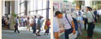
※昨年度の展示会の様子